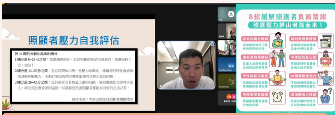
第五場9.6(六)10:00-11:30身心不超載：照顧者的壓力調適指南