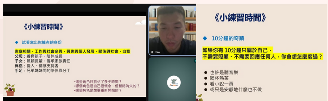
第六場10.4(六)10:00-11:30不只是照顧者：找回自我價值與身分認同