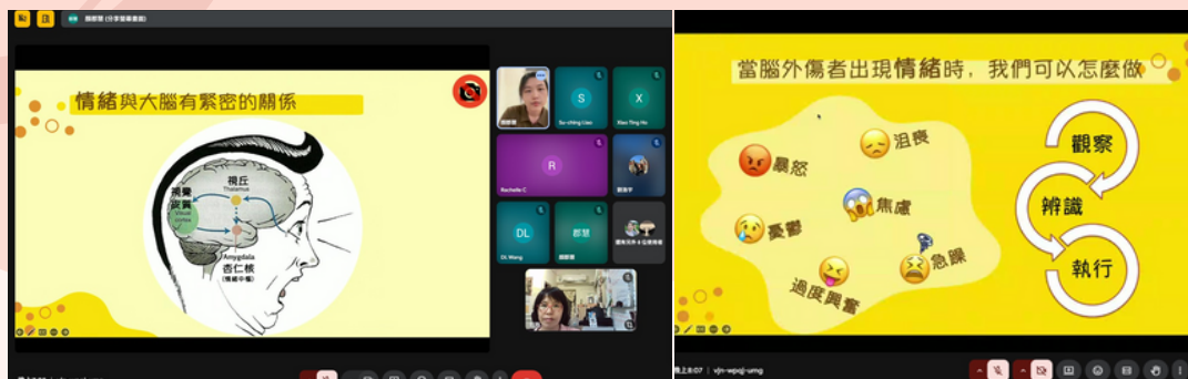
第三場7.23(三)19:00-20:30回穩情緒方向盤—談腦外傷情緒照護技巧