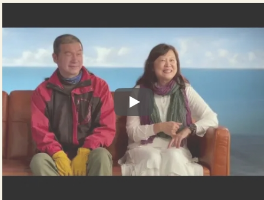
只要不放棄篇 | 宣傳影片

第二支：「腦外傷後遺症之情緒障礙篇」113.2.19 上檔 / 目前觀看次數約 100 人次